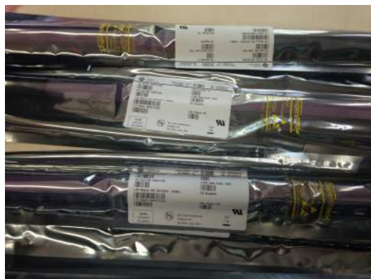
Original mit Herstellerzertifikat