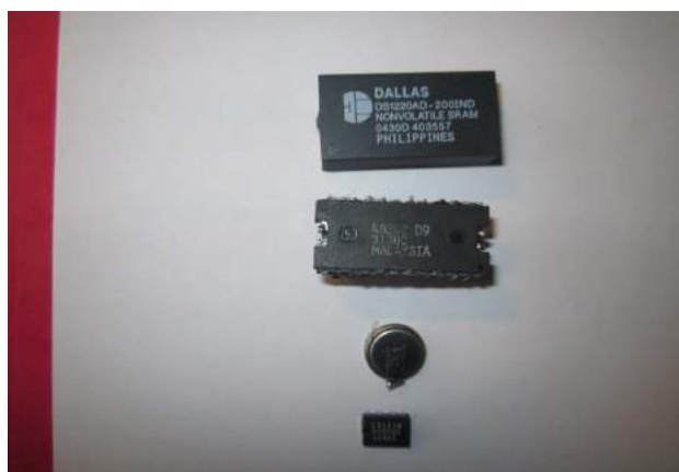
Plagiat eines NV RAM aus unseriöser Quelle / Herstellung

Durch die Zusammenarbeit der BVG mit dem Unternehmen AMSYS ist es gelungen, trotz einer weltweiten Abkündigungsmeldung des Herstellers eine Last Call Bestellung direkt bei dem Halbleiterhersteller zu erreichen. Durch eine Bündelung der Beschaffung für die BVG und der DB konnte AMSYS ein kostengünstigeres Angebot unterbreiten, von dem beide Unternehmen technisch als auch wirtschaftlich profitieren.