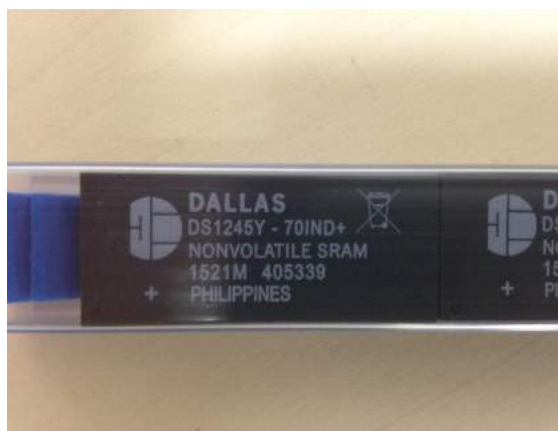
Original mit Herstellerzertifikat